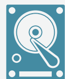
Disque dur Données des fichiers d'utilisateurs, images temporaires d'imprimante/de copieur/de fax, documents stockés pour une impression fréquente, carnets d'adresses